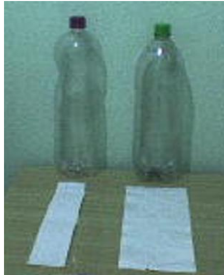
Figura 3 – Área do rótulo: 198 cm 2 após reformulação de ecodesign (esquerda) e a direita área do rótulo 387,6 cm 2 , antes da reformulação da embalagem.

A Figura 3 apresenta duas garrafas distintas e a respectiva mudança no rótulo após o ecodesign .