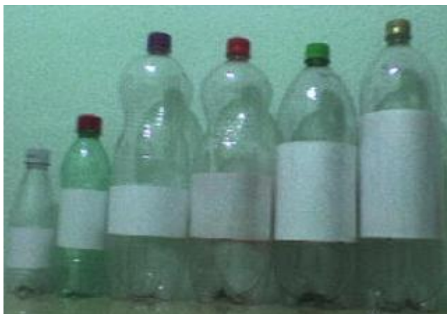
Figura 2 – Comparação das áreas dos rótulos e formatos das garrafas PET.

A Figura 2 apresenta um lote de amostras, com rótulos descaracterizados.